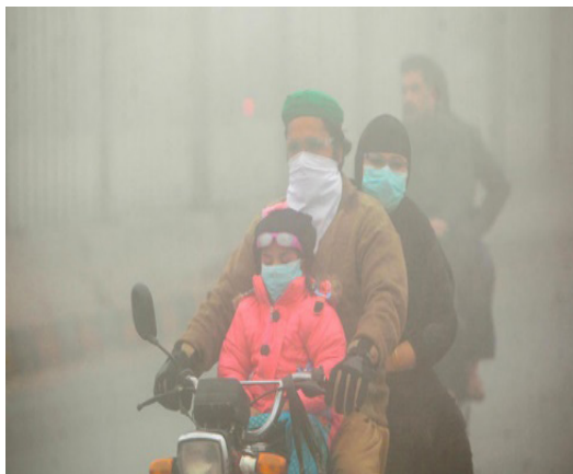
Рис. 3. Изображение группы людей, зафиксированное в условиях недостаточной освещенности