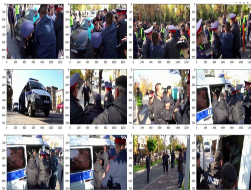
Рис. 4. Представление видеопотока в виде отдельных кадров

Заметим, что первые три задачи являются типичными задачами предварительной обработки изображений перед их подачей в нейросетевую модель заданного типа. Четвертая задача учитывает специфику прикладной задачи исследования, т.е. задачи обнаружения политического экстремизма в социальных сетях за счет интегрального анализа текстовой и графической информации. Для определения эффективных путей решения первых четырех задач проведено исследование некоторых распространенных социальных сетей на предмет особенностей размещения в них изображений и видеопотока.